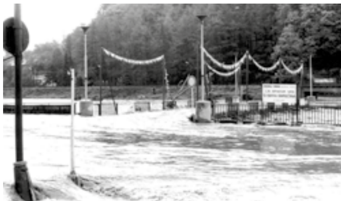
Nový betónový most pri povodni v roku 1974

dlhej doby chodievali pešo na Malú železničnú stanicu (Banská Bystrica – mesto), do kín (Partizán a Praha), do mestských kúpeľov či na Sokolskú plavareň, alebo aj na Kalváriu.