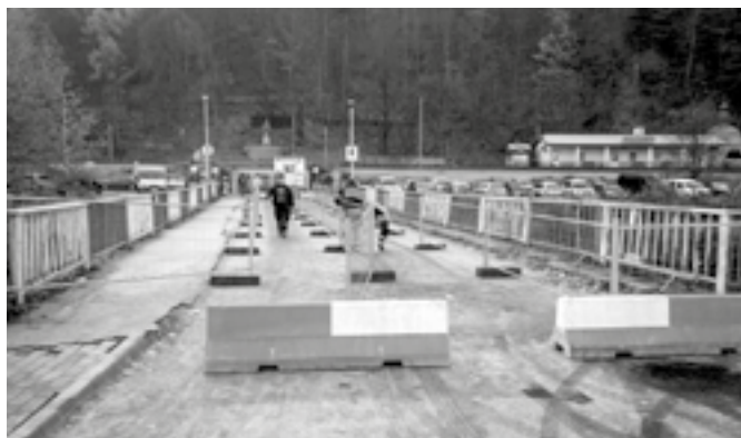
Uzávera mosta, 2025

Koncom päťdesiatych rokov 20. storočia Hron ešte v zime zamrzal a pri jarnom topení zvykli plávať veľké ľadové kryhy, pred ktorými piliere mosta chránili drevené konštrukcie „ľadolamov“ s kovovým uholníkom na zošikmej nárazovej strane. Niekedy súvislý ľad a plávajúce veľké ľadové kryhy narušali aj výbušnami, na čo občas doplávali ešte zimujúce ryby.