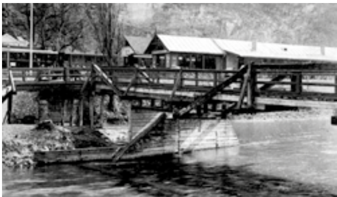
Pôvodný drevený most

Pôvodný drevený most bol situovaný o niekoľko desiatok metrov nižšie oproti dnešnému mostu cez Hron a umožňoval prístup ku Kaplnke svätého Jána Nepomuckého, pochádzajúcej z konca 18. storočia. Súčasne premostoval aj Svätójánsky potok, ktorý bol vedľajším ramenom Hrona a práve tu ústil do jeho hlavného koryta (zasypaný bol v roku 1926). Tento drevený most sprístupňoval od mesta aj vtedajšiu Svätójánsku železničnú stanicu (Szt. István állomás), ktorá vznikla na železničnej trati zo Zvolena, postavenej v rokoch 1872 – 1873.