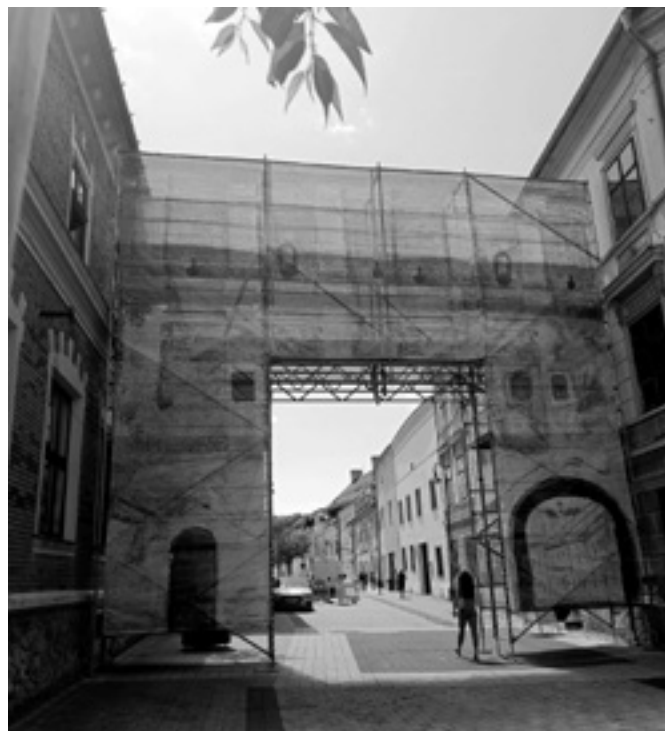
Rekonštrukcia mestskej hradnej brány v Lazovnej ulici, počas Dní mestskej kultúry, 2025