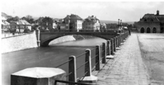
Bellušov betónový most

V roku 1924 postavili a v roku 1925 skolaudovali nový železobetónový most cez Hron, ktorý bol situovaný už v osi Národnej ulice a nahradil tak predošlý, nižšie položený drevený most. Bol to elegantný, jednopólový betónový most bez pilierov, postavený podľa projektu popredného architekta Emila Belluša (1899 – 1979). Tento most bol považovaný za najkrajší zo všetkých mostov v meste. Po dvadsaťročnej prevádzke ho však postihol rovnaký ničivý osud, akému sa nevyhli ani ostatné mosty v meste. Ustupujúci povstanci, na jeseň 1944, most výbuchmi zničili, pričom značne poškodili aj najbližšie okolité budovy.