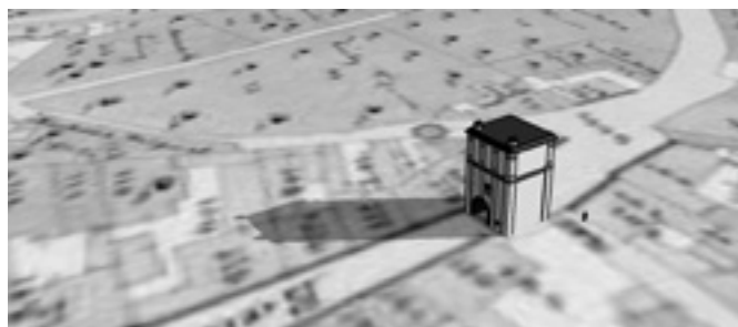
Rekonštrukcia brány – pohľad z „vtáčej“ perspektívy