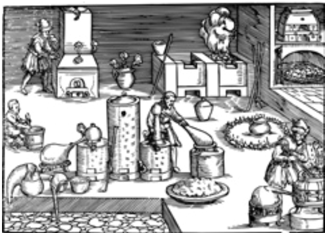
Chemická časť hutníckej dielne drabých kovov, 15. – 16. storočie

Ján (III.) Thurzo de Bethlenfalva, narodený roku 1437 v Levoči, uvádzaný aj ako Ján Thurzo I. alebo inak podobne, nebol napriek prívlastku „de Bethlenfalva“ šľachtického pôvodu. Barónom sa stal až roku 1505. Legenda hovorí, že keď bol ešte ako mladý chlapec na štúdiách v Taliansku, aby sa tam naučil pracovať s rudou, odniesol si odtiaľ tajne znalosť odlučovania striebra z medenej rudy. Práve na tejto znalosti mal neskôr postaviť svoje ďalšie podnikanie. Roku 1469 postavil v Mogile pri Krakove striebornú hutu, kde z rudy dovážanej zo stredoslovenskej banskej oblasti odlučoval za pomoci olova striebro. Ku koncu storočia výrobu medi a striebra preniesol do Banskej Bystrice, kde sa jeho podnik roku 1494 stal základom Turzovsko-fuggerovskej spoločnosti. V banskobystrickom medenom revíri postupne ovládol väčšinu baní a roku 1495 založil šplajsovú hutu spolu s medeným hámmom. Jeho podnikanie v baníctve a hutníctve prinieslo Banskej Bystrici významné postavenie v medzinárodnom meradle.