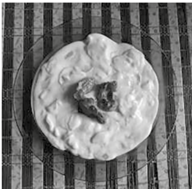
Omačka z čerstvých uharkov, 2025

Olúpané uharky pokrájajú sa na tenké okržielka, poriadno sa musia osoliť, prikryť a položiť stranou. Asi po štvrt hodine treba ich dobre vytlačiť. Vložia sa do žltej zäsmažky, okorenia a nechajú sa chvíľu pariť (dünsten), potom podlejú sa s polievkou, naleje sa do toho trochu octu a zopár lyžičiek kyslej smotany.