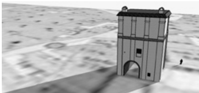
Rekonštrukcia brány – pohľad od mesta