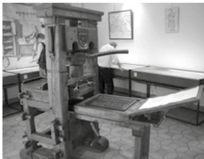
Gutenbergov tlačiarenský stroj