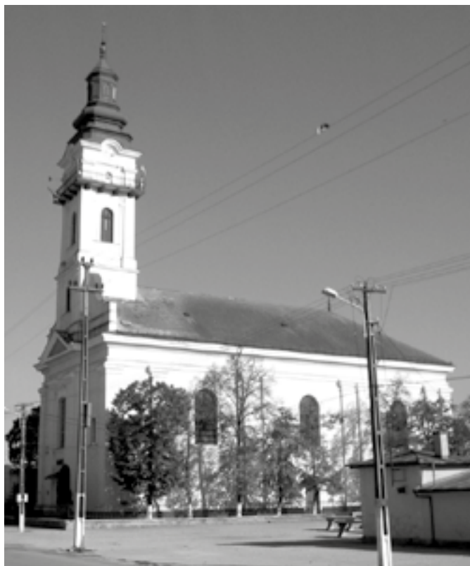
Evangelický kostol v Nadlaku